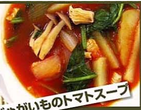
じゃがいものトマトスープ

ようてい男しゃく 2個 (もしくはとうや) 1個 玉ねぎ 1個 ほうれん草 1/2束 とうり肉(胸) ミートソース 50g 1缶 3カップ 水 適量 塩・こしょう・中華だし 適量 トマトケチャップ 適量