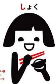
みんなのよい食 プロジェクト シンボルマーク 笑味ちゃん