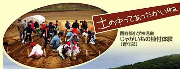
土の中であつたかいゆ 留寿都小学校児童 じゃがいもの植付体験 (青年部)