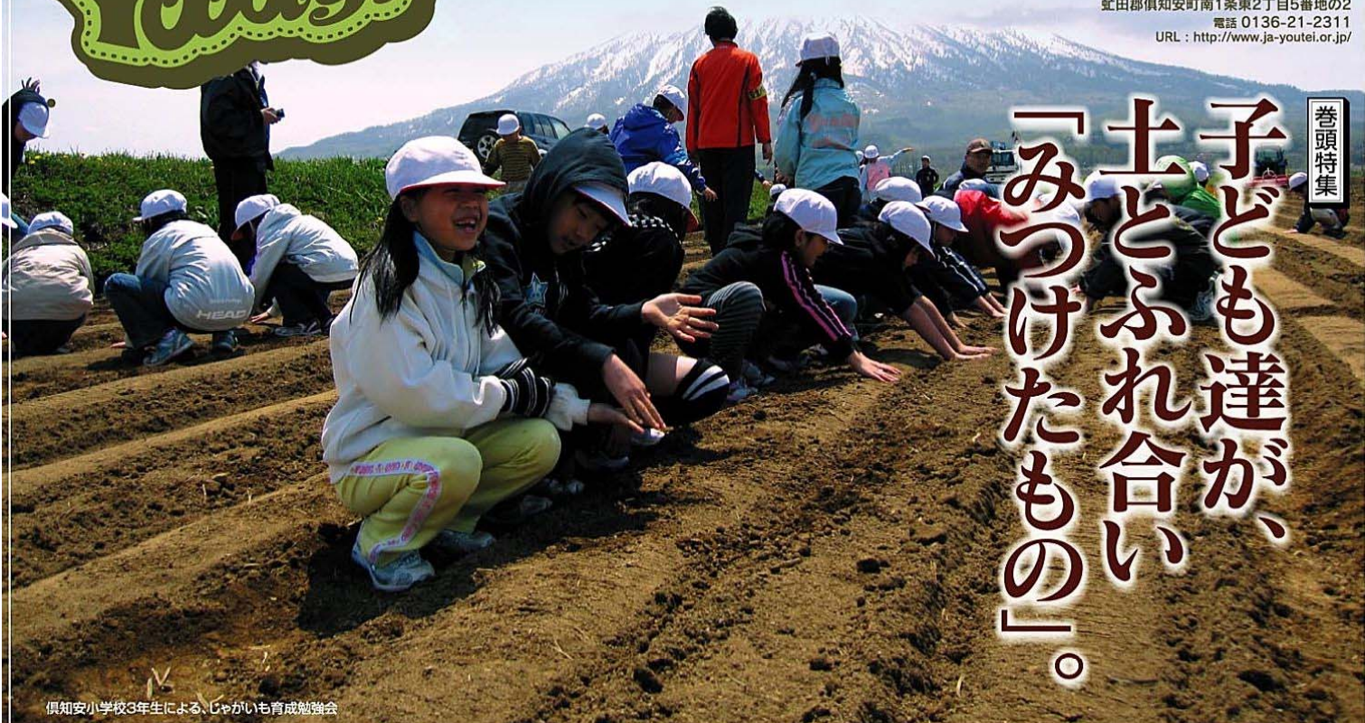
倶知安小学校3年生による、じゃがいも育成勉強会

「食」に「農業」は欠かせない存在。 JAようていは、さまざま 「食農教育」を推進しています。