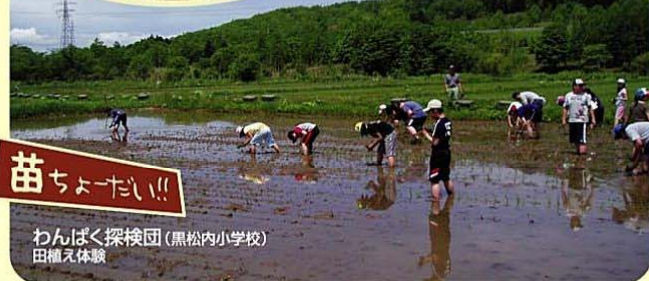
苗ちよーだい!! わんぱく探検団(黒松内小学校) 田植え体験