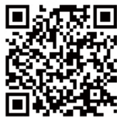
Google MAP QR