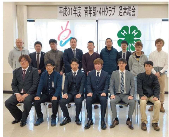
新体制でスタートします！