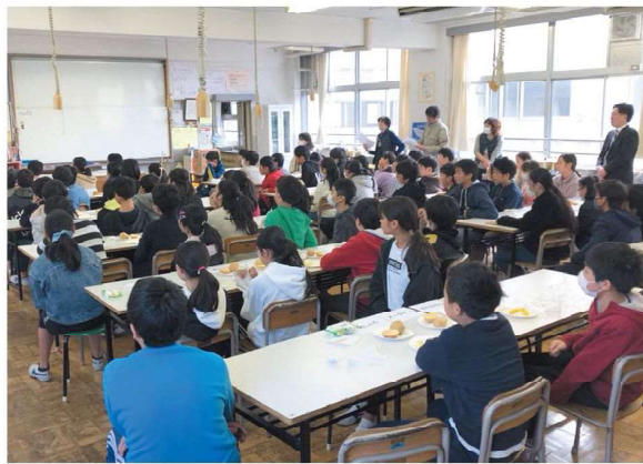
太田区立梅田小学校

明や、馬鈴しょの用途と品種、年間の農作業などクイズを交えて紹介し、子供たちからは「食べる芋と種芋の違いは何ですか」や「なぜ芋の芽は毒があるのか」など沢山の質問がありました。