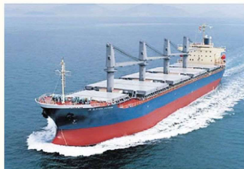
肥料の海上輸送(全農HPより引用)