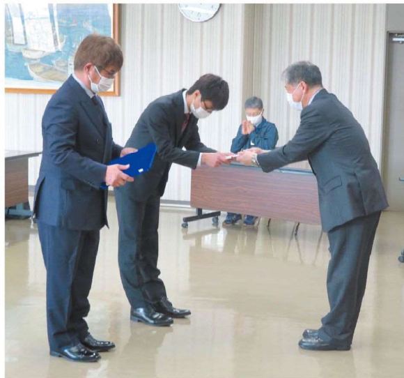
北海道農産協会 大西常務理事より表彰状の伝達

また、昨今の情勢に伴い、表彰式の開催は中止となりましたが、3月10日に当JA本所にて、北海道農産協会より最優秀賞の表彰状の伝達が行われました。受賞者の皆様おめでとうございます。