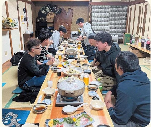
交流を深める貴重な機会となりました！