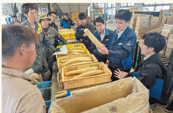
目合わせ会の様子